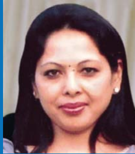
श्री अन्नपूर्ण श्रेष्ठ प्रबन्धक